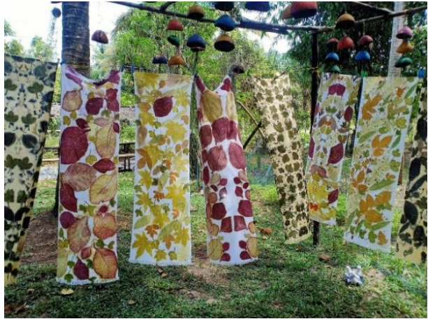
จากนั้น แวะชมศูนย์หัตถกรรมกลุ่มกะลามะพร้าว ผลิตภัณฑ์จากกะลามะพร้าว