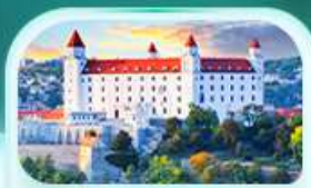
ปราสาทปราติสลาวา

เที่ยวชมเมืองอัลส์ตัดท์ หมู่บ้านริมทะเลสาบสวยที่สุดในโลก พระราชวังเชินบรุนน์ เมืองลินซ์ จิตรกรรมฝาผนังยักษ์ สัมผัสเมืองมรดกโลก เซสท์ ครุมลอฟ เยี่ยมชมปราสาทปราก ถนนทองคำ เช็คอินสถานที่ชื่อดัง! ปราสาทปราติสลาวา ล่องเรือชมความงามแม่น้ำดานูบ แม่น้ำที่ยาวที่สุดในยุโรป ชมความน่าหลงใหลของ ปราสาทบูคาเปสต์ สะพานชาร์ลส์