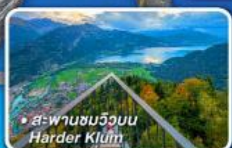
• สพานขมวิวน Harder Klamm