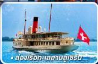
• สองเรือทะเลสาบลูเซิร์น