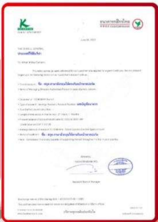
ตัวอย่าง Bank Guarantee ที่ผู้สมัครต้องยื่นขอธนาคาร