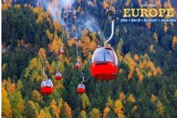
นำท่านนั่งกระเช้าลงที่สถานี Seis am Schlern

📍 บริการอาหารเช้า ณ ห้องอาหารของโรงแรม (มื้อที่5)