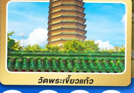
วัดพระเจี๊ยะกั๋ว

เมนูพิเศษ เปิดปักกิ่ง, ชาหมูหม้อไฟ อาหารกวางตุ้ง, อาหารเสฉวน