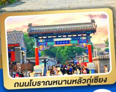
ถนนโบราณหนานหลิวกู่เซียง