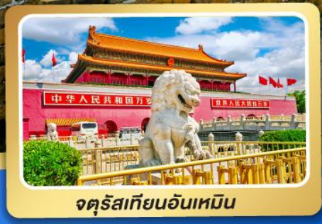
จตุรัสเทียนอันเหมิน