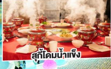
สุกี้โดมน้ำแข็ง