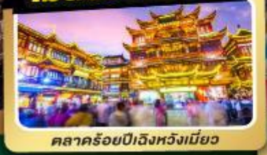
ตลาดร้อยปีเจิ้งหวังเหมียว