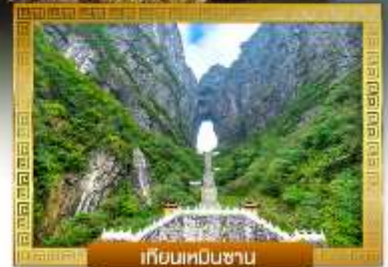
เทียนทงซาน