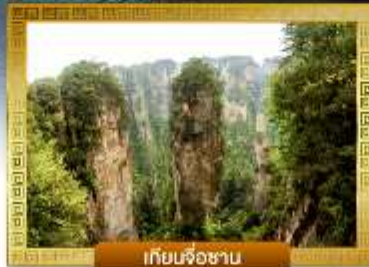
เทียนจื่อซาน