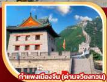
กำแพงเมืองจีน (ด่านจวิยงกวน)