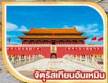
จักรีสเทียนอันเหมิน