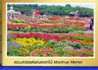
สวนสวรรค์แห่งดอกไม้ Manhua Manor