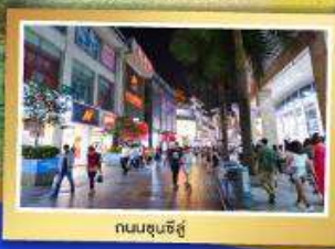
ถนนชุนชี่