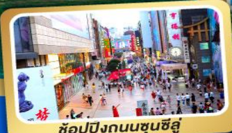
ช้อปปิ้งถนนชุนชี่อู๋