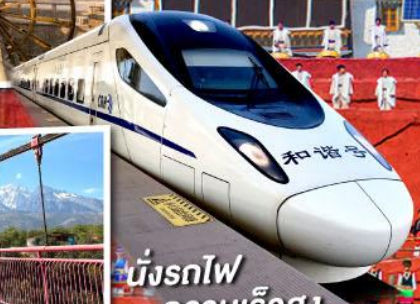
นั่งรถไฟ ความเร็วสูง