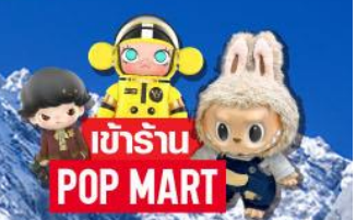
เข้าร้าน POP MART