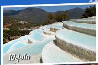
ไป๋ยู่โก

เที่ยวครบทุกไฮไลท์ • ไม่ลงร้านช้อปปิ้ง • พักโรงแรม 4 ดาว