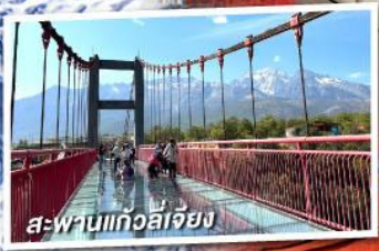
สะพานแก้วลี่เจียง