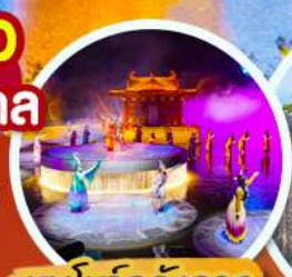
ชมโชว์อสังการ