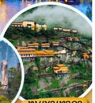
ชมเขาเทวดา

เมนูพิเศษ!! เป็ดปักกิ่ง หมูแดง ปลาหมักเบียร์อ๊ฮวาง