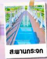
สะพานกระเจก