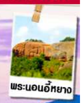
พระนอนอภัยยา