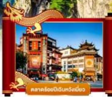
ตลาดร้อยปีเวิ่นหวงเมี่ยว

• ถ่ายรูปหาดไว่กาน เติบที่เขยวลาตร้อยปีเซียงไฮ้