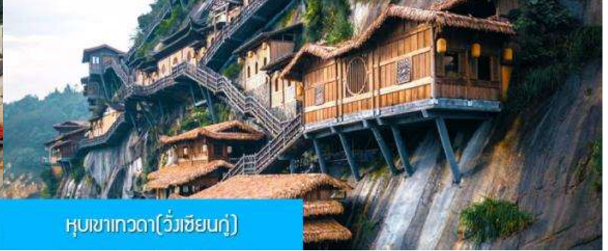
หุบเขาเทวดา(วังเซียนกู่)

วันที่สอง หมู่บ้านโบราณหวงหลิ่ง – หุบเขาเทวดา(วังเซียนกู่) – เมืองชังเหรา