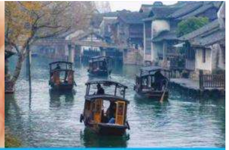
เมืองโบราณผู่ยวน