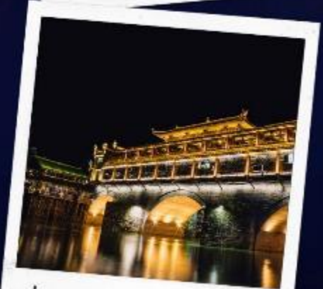
ล่องเรือแม่น้ำถั่วเจียง