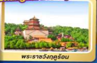
พระราชวังกุรุง