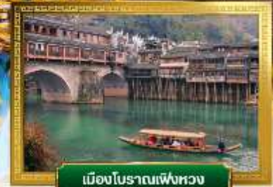
เมืองโบราณเฟิงหวง