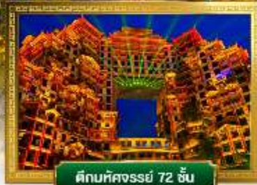
ตึกมหัศจรรย์ 72 ชั้น