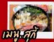
เมหู่ซูกี้

สุสานทหารดินเผาจีนซี ถ้ำหลงเหมิน ถนนวัฒนธรรมราชวงศ์ถัง ถนนคนเดินประตูโบราณสี่จีนเหมิน กำแพงเมืองโบราณ ร้านPOP MART วัดเล่าหลิม ป่าเจดีย์ ชมการแสดงกังฟู