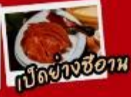
ปัดยงซีอาน