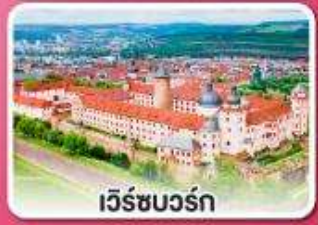
เวียร์ชบวร์ค