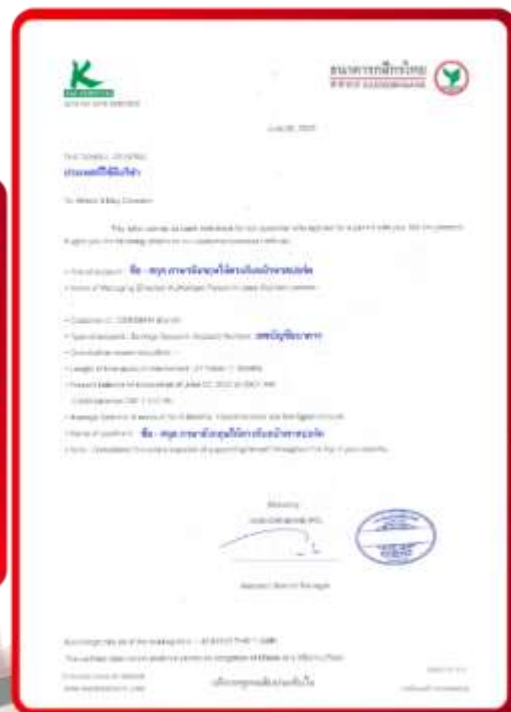
ตัวอย่าง Bank Guarantee ที่ผู้สมัครต้องเตรียมมาหาเรา