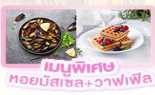
เมนูพิเศษ หอยมัสเซล+วาฟเฟิล