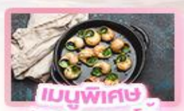
เมนูพิเศษ หอยออสตาโก้

เยอรมัน เนเธอร์แลนด์ เบลเยียม ฝรั่งเศส Keukenhof