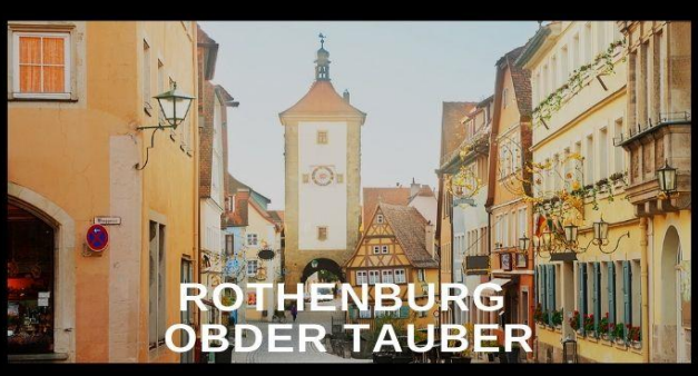
ROTHENBURG OBDER TAUBER