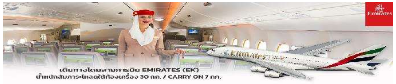
เดินทางโดยสารการบิน EMIRATES (EK) น้ำหนักสัมภาระ-โหลดใต้ท้องเครื่อง 30 กก. / CARRY ON 7 กก.

** การ์ันตี 15 ท่านออกเดินทาง พร้อมหัวหน้าทัวร์คนไทย **