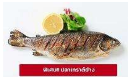
พิเศษ! ปลาเทราต์ย่าง

เกียง 🍴 รับประทานอาหารเกียง (มื้อที่6) เมบูพิเศษ ปลาเทราต์ย่างท่านละ 1 ตัว นำท่านเดินทางสู่ เมืองมรดกโลกเชสกี คุรมลอฟ (Cesky Krumlov) สาธารณรัฐเช็ก (ระยะทาง 210 กม./ 3.30 ชม.) ล้อมรอบด้วยแม่น้ำ Vltava ทำให้เมืองแห่งนี้มีลักษณะคล้ายหยดน้ำ จนถูกขนานนามว่าเป็น "เมืองหยดน้ำ" จากนั้นนำท่านถ่ายรูปบริเวณรอบนอก ปราสาทคุรมลอฟ (Cesky Krumlov Castle) เป็นปราสาทกอธิกดั้งเดิม ตั้งอยู่ริมฝั่ง