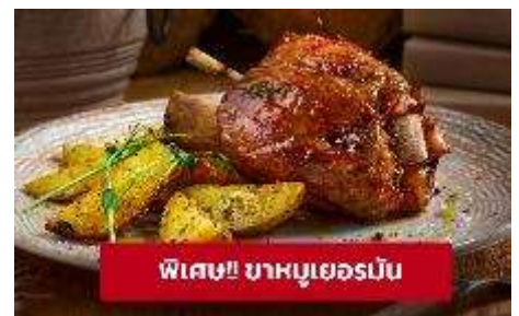
พิเศษ!! ขาหมูเยอรมัน

ที่พัก : Hotel Goldenes Schiff หรือโรงแรมระดับใกล้เคียงกัน (ชื่อโรงแรมที่ท่านพัก ทางบริษัทจะทำการแจ้งพร้อมใบนัดหมาย 5-7 วัน ก่อนวันเดินทาง)