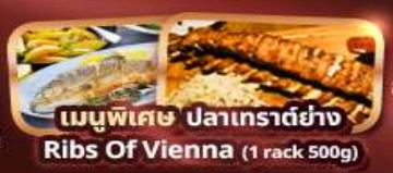
เมนูพิเศษ ปลาเทราต์ย่าง Ribs Of Vienna (1 rack 500g)

บริการนำดื่มวันละ 1 ขวด ฟรี! ปลั๊กไฟยูนิเวอร์แซล