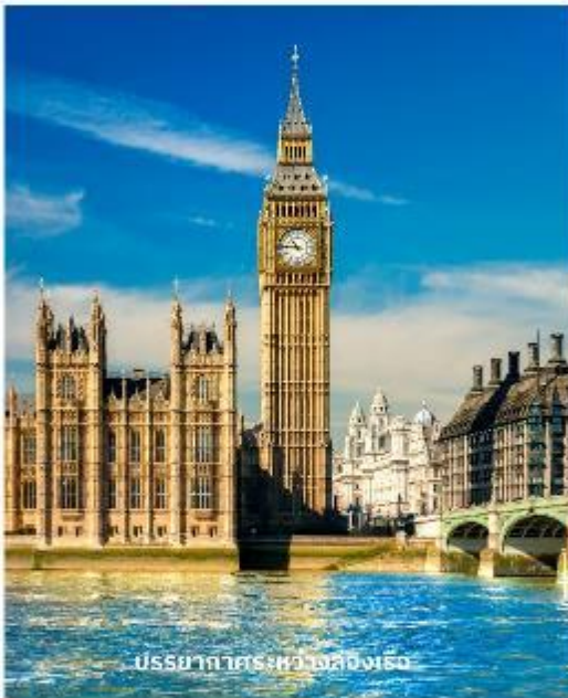
บรรยากาศระหว่างส่องเรือ

จากนั้นนำท่านผ่านชม พระราชวังบักกิงแฮม ก่อนนำท่านเก็บภาพสวยๆที่ หอนาฬิกาบิกเบน สัญลักษณ์ที่สำคัญของลอนดอนที่ตั้งอยู่เคียงข้างอาคารรัฐสภาที่สวยงามริมฝั่งแม่น้ำเทมส์ จากนั้นผ่านชมสถานที่สำคัญต่างๆ อาทิ บ้านเลขที่ 10, ถนนดาวนนิ่งกำเนิดนายกรัฐมนตรี, จัตุรัสทราฟัลการ์, อนุสรณ์แห่งสงครามทราฟัลการ์ของท่านลอร์ดแนลสัน, พิคคาเดิลลี เซอร์คัส, ย่านโซโฮ ฯลฯ