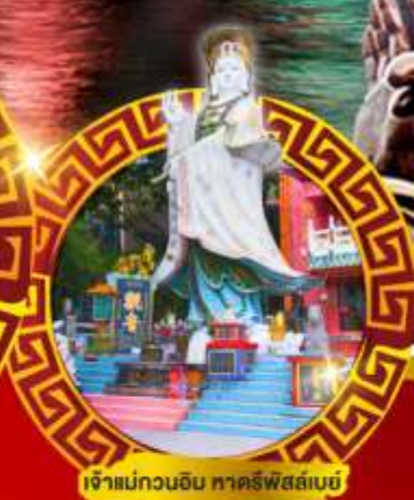
เจ้าแม่กวนอิม ทาครีฟัสส์เบย์