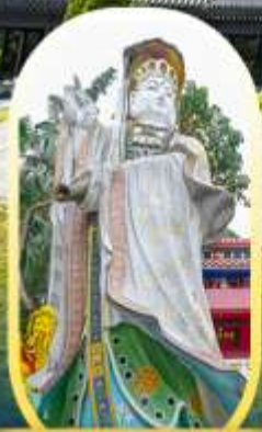
วัดเจ้าแม่กวนอิมรี พลัสเบย์