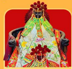
เจ้าแม่กวนอิมสองอำ