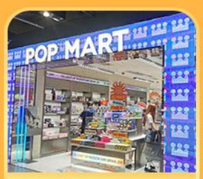
ช้อปปิ้ง POP MART