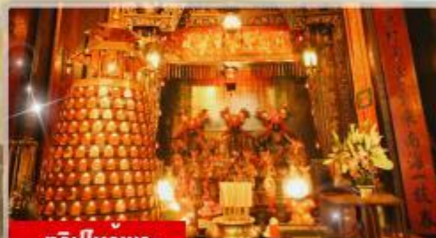
ทริบไหวพร: