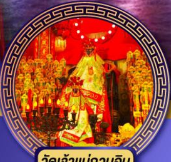
วัดเจ้าแม่กวนอิม ฮองฮ่า