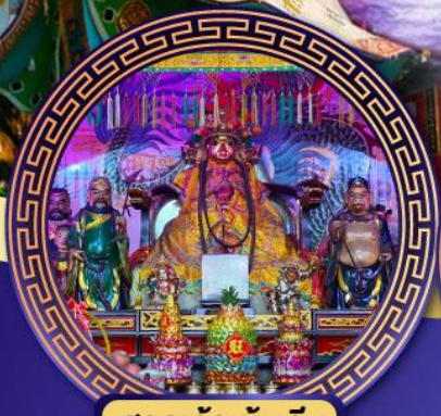
ศาลเจ้าหั่งเจีย