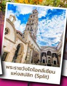
พระราชวังไดโอสคลีเซียน แห่งสปลิต (Split)