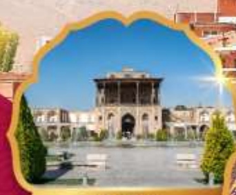
Ali Qapu Palace