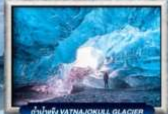
ถ้ำน้ำแข็ง VATNAJOKULL GLACIER

บินตรง สายการบิน Full Service | พิเศษ! ทานอาหารโดนตรง-จกวีว 360 องศา