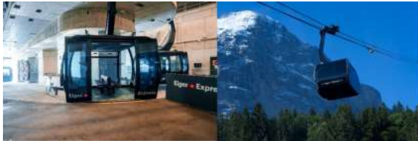
Highlight ! พิกัดยอดเขาจุงเฟรา โดยนักกระเช้า Eiger Express ที่ทันสมัยที่สุดใน ยุโรป ต่อด้วยรถไฟไต่เขาจากสถานีรถไฟที่ สูงที่สุดในยุโรป สมฉายา Top Of Europe

เช้า ๑๑ รับประทานอาหารเช้า ณ โรงแรม (มื้อที่5) นำท่านเดินทางไปสู่ สถานีกรินเดลวัลด์ (Grindelwald Terminal) (ระยะทาง 86 ก.ม./ 1.45 ชม.) เพื่อขึ้น กระเช้าลอยฟ้าไอเกอร์เอ็กเพรส (Eiger Express) สู่ สถานีไอเกอร์เกลตเชอร์ (Eigergletscher) ซึ่งเป็นจุด เชื่อมต่อให้ท่านเปลี่ยนขึ้นรถไฟจุงเฟราเพื่อนำท่านสู่ ยอดเขาจุงเฟรา (JUNGFRAUJOCH) ซึ่งเป็นสถานีรถไฟที่ สูงที่สุดในยุโรป ที่ความสูง 3,454 เมตร