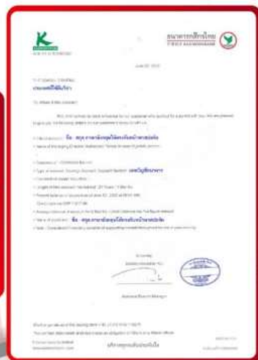
ตัวอย่าง Bank Guarantee ที่ผู้สมัครต้องยื่นกับธนาคาร