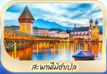
สะพานไมซ์ฮาป