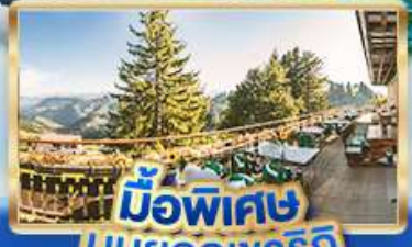
มือพิเศษ บินยอดเขาริท