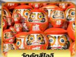
วัดคังสึโอจิ