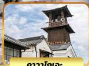
คาวาโกเอะ