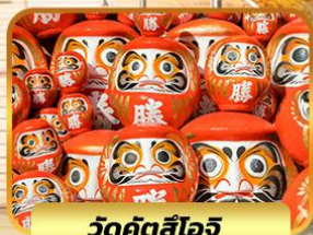
วัดคิตสึโงอิ