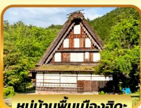
หมู่บ้านพื้นเมืองฮิดะ