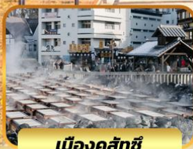
เมืองคุสัทซึ