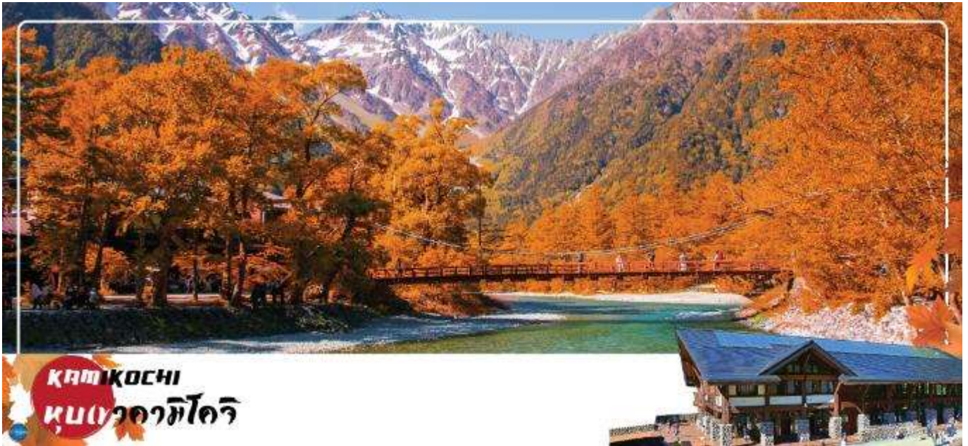
KAMIKOCHI หุบเขาคิโตะ

จากนั้นนำท่านเดินทางสู่ คามิโคจิ (Kamikochi) (ใช้เวลาเดินทางประมาณ 50 นาที) แหล่งท่องเที่ยวทางธรรมชาติที่มีทิวทัศน์เขาที่สวยงามที่สุดแห่งหนึ่งของประเทศญี่ปุ่น ดินแดนแห่งธรรมชาติท่ามกลางหุบเขาแสนสวยของเทือกเขา "เจแปน แอลป์" (Japan Alps) เป็นหุบเขาในพื้นที่อยู่สูงขึ้นไปทางเหนือของเทือกเขาแอลป์ญี่ปุ่น ภาพสายน้ำของแม่น้ำอะซุสะ ที่ใสสะอาดไหลผ่านสะพานคัปปะ ล้อมรอบด้วยต้นป่าเขียวขจี และฉากหลังของยอดเขาสูงตระหง่านระดับ 3,000 เมตรให้ท่านได้เพลิดเพลินกับการเดินเล่นสบายๆ ไปกับธรรมชาติที่สวยงาม อิสระให้ท่านได้เก็บภาพความประทับใจตามอัธยาศัย สะพานคัปปะ-บะชิ เป็นจุดที่มีคนเยอะที่สุดในคามิโคจิ และในบางครั้งก็ให้ความรู้สึกเหมือนทางแยกที่มีชื่อเสียงของชินจูกุ มีผู้คนมากมายเดินข้ามไปข้ามมาอยู่ไม่หยุดหย่อน มาถ่ายรูปใกล้กับสะพานหรือบนสะพาน