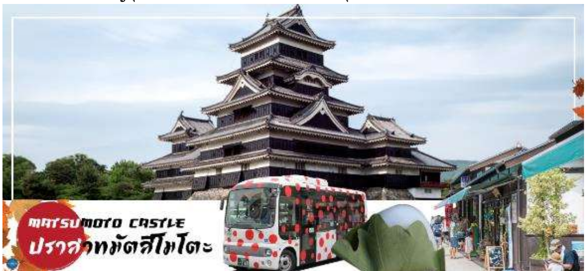
MATSUMOTO CASTLE ปราสาทมัตสึโมโตะ

นำท่านชม ปราสาทมัตสึโมโตะ (Matsumoto Castle) (ด้านนอก) เป็น 1 ใน 12 ปราสาทดั้งเดิมที่ยังคงสภาพสมบูรณ์และสวยงามที่สุดของประเทศญี่ปุ่น และเป็น 1 ใน 5 ปราสาทที่ได้รับการขึ้นทะเบียนเป็นสมบัติประจำชาติ เป็นปราสาทที่สร้างอยู่บนพื้นที่ราบ มีเอกลักษณ์ตรงที่มีหอคอยและป้อมปืนเชื่อมต่อกับโครงสร้างอาคารหลัก และเนื่องจากผนังปราสาทมีสีดำและปีกด้านต่างๆ ของปราสาทแผ่กางออกเหมือนปีกนก เลยมีชื่อเรียกว่า คาราซุโจ ที่แปลว่า ปราสาทอึกา สำหรับข้างในตัวปราสาทมีชั้นบันไดสูงชันและเพดานที่ไม่สูงมาก บริเวณทางเดินจัดแสดงวัสดุเครื่องใช้ทางประวัติศาสตร์ เช่น ชุดเกราะซามูไรสมัยเซ็นโกกุ, ปืนคาบศิลาและอาวุธที่เคยใช้สู้รบในสมัยก่อนหน้าต่างเป็นหน้าตาต่างไม่แคบๆ มีช่องสำหรับยิงปืนและยิงลูกธนู ท่านสามารถเพลิดเพลินกับทัศนียภาพของเทือกเขาแอลป์ญี่ปุ่นและเมืองมัตสึโมโตะได้จากชั้นบนสุดของปราสาทแห่งนี้