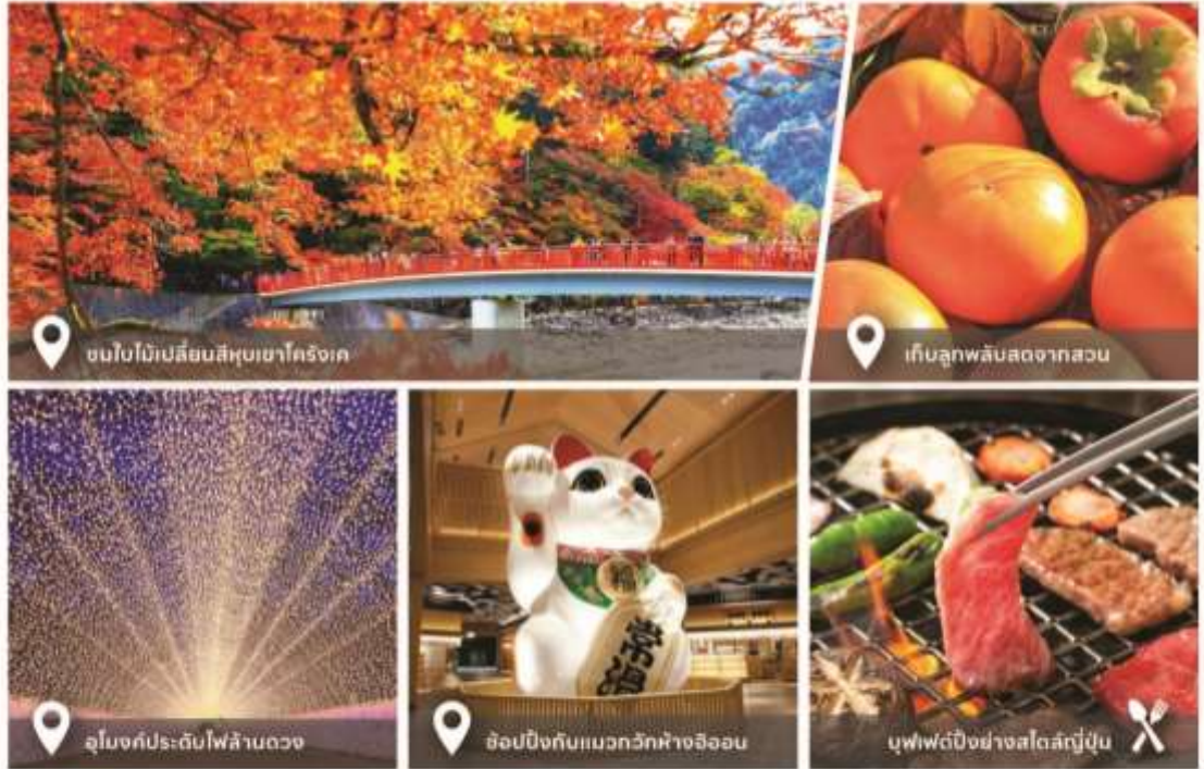
ชมใบไม้เปลี่ยนสีหุบเขาโคริงเค