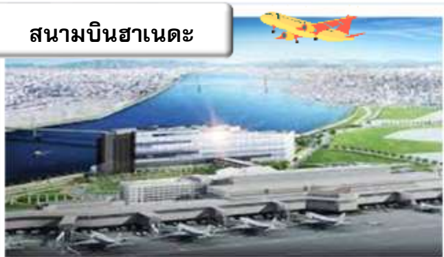
สนามบินฮานอย

22.45 น. ออกเดินทางสู่ สนามบินฮานอย ประเทศญี่ปุ่น โดย สายการบินไทย เที่ยวบินที่ TG 644