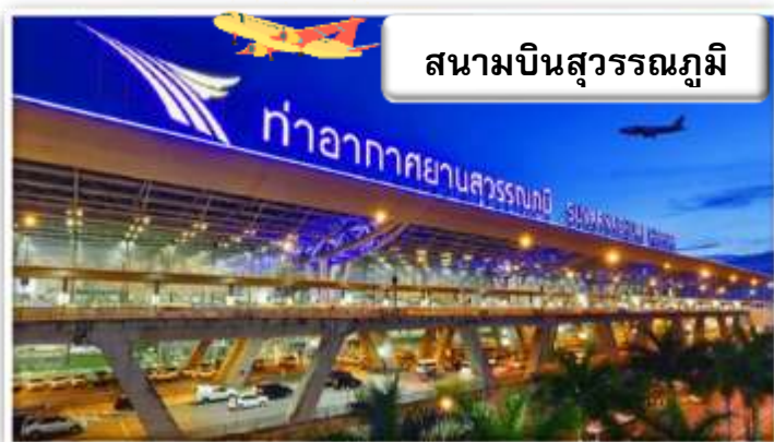
สนามบินสุวรรณภูมิ

เวลา 19.30 น. พร้อมกันที่ ท่าอากาศยานสุวรรณภูมิ อาคารผู้โดยสารขาออกระหว่างประเทศ เคาน์เตอร์ สายการบินไทย เจ้าหน้าที่คอยให้การต้อนรับ ดูแลด้านเอกสาร เช็คอิน และสัมภาระในการเดินทาง