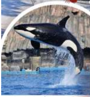
พิพิธภัณฑ์สัตว์น้ำท่าเรือนาโกย่า