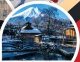
หมู่บ้านโอฮิโนะฮักโก