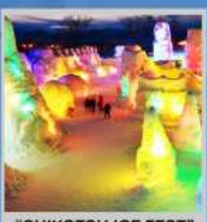
"SHIKOTSU ICE FEST"