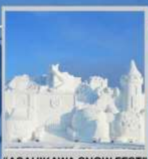
"ASAHIKAWA SNOW FEST"