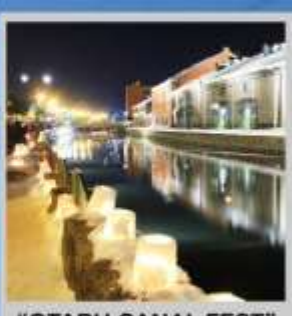
"OTARU CANAL FEST"