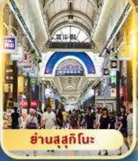
ย่านสุซุกิโนะ