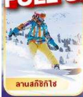
ลานสกีซิกิไซ