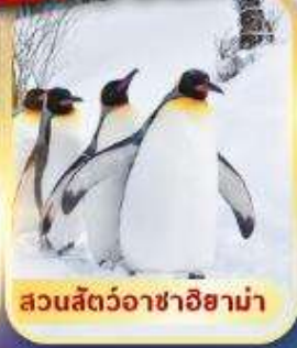
สวนสัตว์อาซาฮิยาม่า