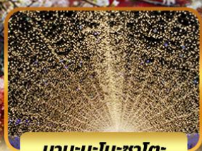
นาบะนะโนะซาโตะ