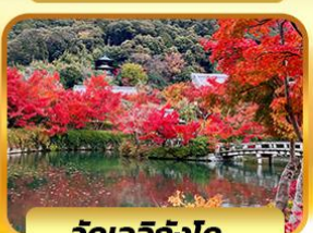
วัดเออิทังโด