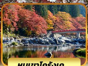
หุบเขาโคริงเค