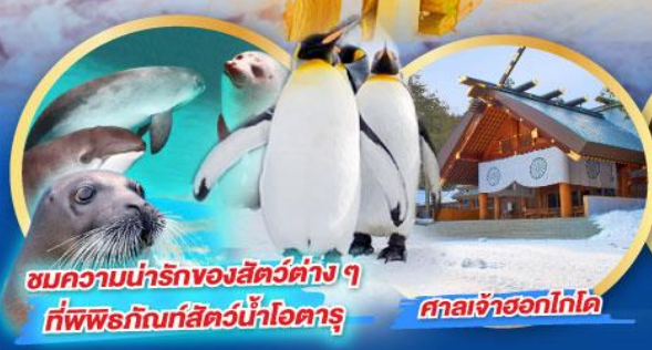
ชมความน่ารักของสัตว์ต่างๆ ที่พิพิธภัณฑ์สัตว์น้ำโอตารุ