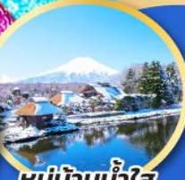
หมู่บ้านน้ำใส โอชิโนะอึกิโก