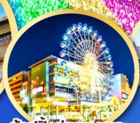
ช้อปปิ้งย่านซากาเอะ