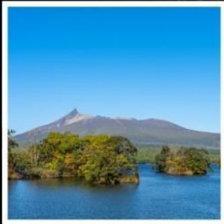
อุทยานแห่งชาติโอโนมะ