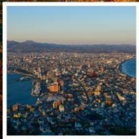
กระเช้าภูเขาฮาโกดาเตะ