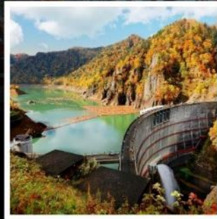
สันเขื่อนโอเฮเคียว