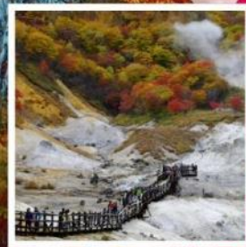
หุบเขานรก จิโคะคุดาบิ