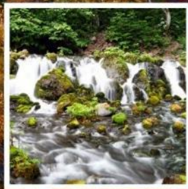
สวนฟูจิตาชิพาร์ค