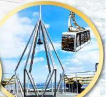
นั่งกระเช้าชมวิวเมืองซัปโปโร MT:MOIWA